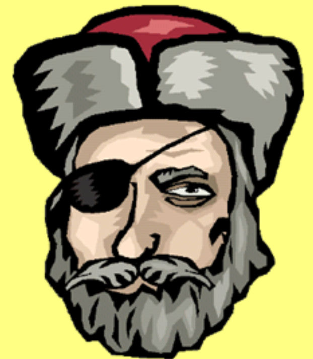
Neporazitelný hejtman Jan Žižka