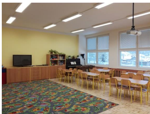
školní družina má samostatné místnosti