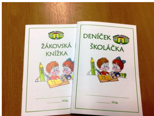
máme své deníčky 1.+2.roč. a ŽK roč.