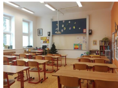
moderně a pěkně vybavené třídy